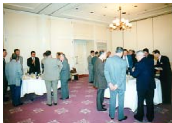
和やかに行われた懇親会